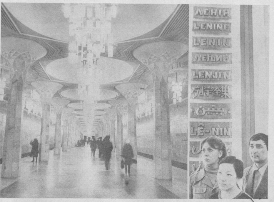
● Октябрь революцияси номдаги завод. Ильичга ўрнатилган дастлабки ҳайкаллардан бири шу ерда қад кўтарган. ● Тошкент метрополитени ва унинг станцияларидан бири В. И. Ленин номи билан аталади. ● Лениннинг номи ер юзиданги барча қишлоқлар учун азиз ва машҳурдир.