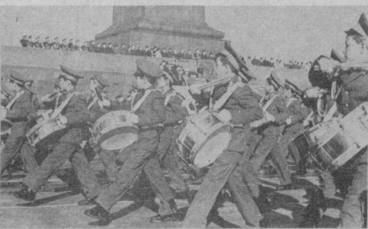
СУРАТДА: намоишчиларнинг байрам колонналарида ва ҳарбий парад қатнашчилари.