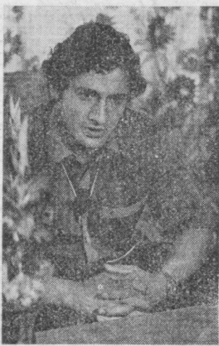
Моснавадаги XXII Олимпиада ўйинларида ярим ўрта вазндаги штанга...