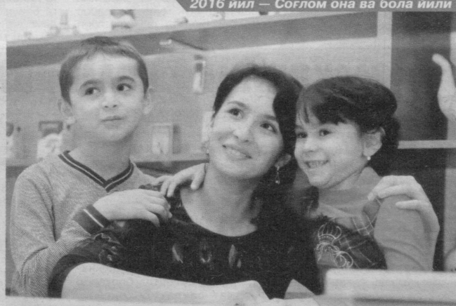
2016 йил — Соғлом она ва бола йили

Жаҳон соғлиқни сақлаш ташкилоти маълумотларига кўра, инсон саломатлигининг 50-52 фоизи турмуш тарзига, истемол қилаётган озиқ-овқатига, 20 фоизи атроф-муҳит таъсири ва 8-10 фоизи тиббий хизмат даражасига боғлиқ. Бундан кўринадиги, витаминларга бой маҳсулот истеъмоли қилиш, соғлом турмуш тарзига эътиборли бўлиш соғлом ҳаёт кечирининг асосий омилдир.