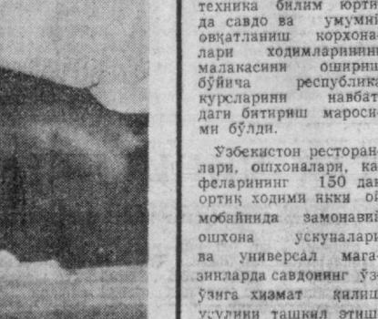
Мавлада Мирзозова ўзи йилдан бери «Тошкент» меъбел ишлаб чиқариш бирлашмасининг 3-цехида сайқалловчи бўлиб ишлаб келади.

Ушбу йилнинг кўп қисмида қурилиш ишлари қўзғалиб кетган.