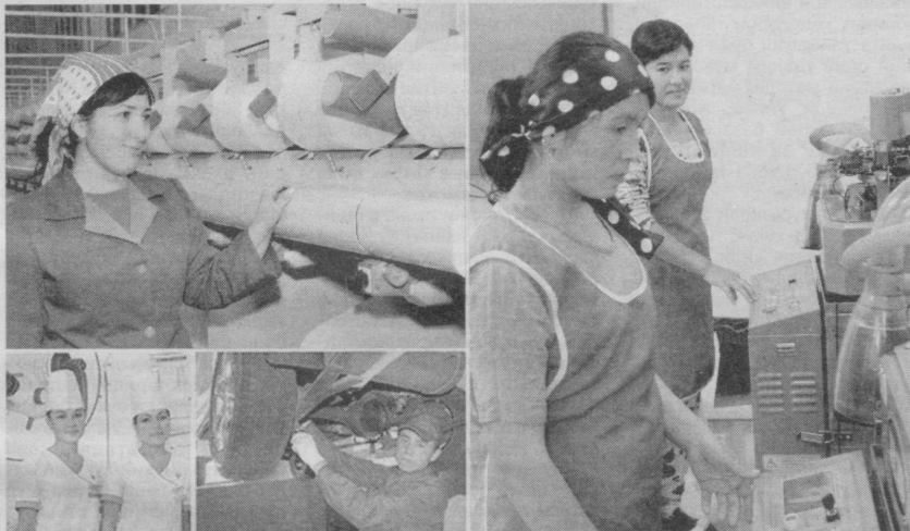
/Давоми. Бошланиши 1-бетда/

Ушбу "Кўшма кўрсатма"га асосан юқорида қайд этилган масъул идоралар вакилларида иборат ишчи гуруҳлари тузилиб, уларга жойлардаги ҳар бир қишлоқ аҳоли пунктлари ва маҳаллаларда тадбиркорлик фаолияти билан шуғулланиш истагида бўлган шахслар билан учрашувлар ўтказиш, мамлакатда тадбиркорликка кенг йўл ва имкониятлар очиб берилганлигини тушунтириш, қонуний фаолият юритиш учун имкониятлар яратиб бериш, тегишли рухсатларсиз тадбиркорлик билан шуғулланаётганларни рўйхатдан ўтган ҳолда фаолият юритишига амалий ёрдам кўрсатиш каби вазифалар юклатилди.