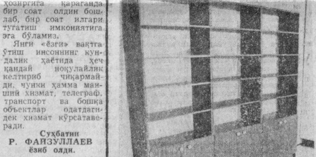
Ташкент ошхона ва бошқа турдаги мебеллар заводи коллективни келаси йилдан бир қанча янги мебел намуналарини ишлаб чиқаришга киришди. Бу мебеллар энг пишиқ ва нафис материаллардан тайёрланади.

СУРАТДА: ишлаб чиқаришга тайёрланаётган нитоб жавонининг янги намунаси.