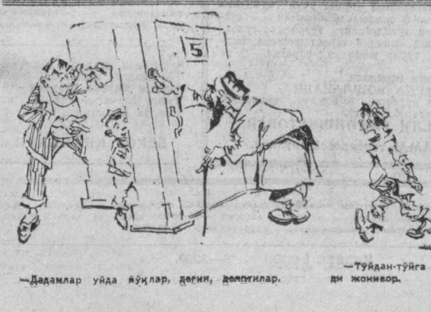
—Тайдан-тўйга юриве риб ювоб бўлиб қолчб-ди жонивор.

Эндиғина сувни қўйсам, [Ховлида мен эдим янча], Дуан тинка ола ҳақик, Шовқин солчб келиб-кетди. Совуимни илб кетди, Чола қолб ювинишим, Бошдан учди ақлу ҳўшим. —Вой-буй, уят, уят, Аббос, Хафа бўйдим сендан бироз.