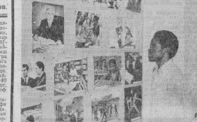
Мали республикасида Совет Иттифоқи кўп миллатли қардошлик оиласи номидан қатнашган Узбекистон ССРининг бой маданияти, санъати билан ҳам яқиндан танишдилар. Сўрашда: Баманақоғи рус тили курси биносида ташкил этилган «Бугунги Узбекистон» фотосенди.