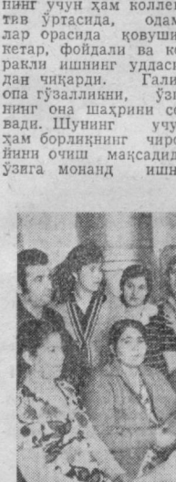
Меҳнатқилларнинг дам олиши учун ширин муносабатда бўлиб кетган уланган ёки турмушга чиққан ўғил ва қизларнинг хонадонлари ҳам тўқин-сонини. Уларнинг радиоприёмниклар, телевизорлар, гиламлар, замонавий мебеллар, ҳатто иккита автомашина ҳам бор.