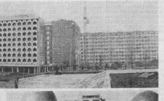
Суратларда: янги минорайоннинг участкаларидан бири; Тошкент тепловоз депонисини ичкиси Эдуард Лютый оиласи ширин муносабатда бўлиб кетган уланган ёки турмушга чиққан ўғил ва қизларнинг хонадонлари ҳам тўқин-сонини. Уларнинг радиоприёмниклар, телевизорлар, гиламлар, замонавий мебеллар, ҳатто иккита автомашина ҳам бор.

Курлини бошлангандан бери мазкур минорайонда 800 га яқин оила уй тўйларини нишонлади.