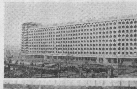
Тошкентнинг ушбу минорайонини шаҳарнинг бош транспорт артериалари қорғасида қад қўтариб, унинг марказий қисмини чинзорнинг улкан кўришлар раёони билан туташтирган бўлиши. Эски Олмазорнинг пастмақ уйлари ва тор кўчалари ўрнида кўп қаватли турар жой бинолари, мазмуни ва маданий-маиший объектлар бунёд этилди.

Тоҳир ака мийиғида изохлайди: болаларни тарбиялаб вожага етказишнинг бу давлатимизнинг ўзини эрдан бермоқда. Бу хонадоннинг ўғил ва қизлари турли имтиёзлардан фойдаланишди. — Масалан, болалар бағирасида тарбияланган мактабда ўқини давлат ҳисобига, ота-она болаларни боқиб учун ҳар ойда давлатдан етарли маблағ олади. Опанинг умумий даражаси шундай тақсимланади, ҳамма-нинг тўғиб оқиланиши, ҳушбоним кийиниши учун етиб-орлади. Бу онлада рўзгорини бўлак қилиб чиқиб кетган уланган ёки турмушга чиққан ўғил ва қизларнинг хонадонлари ҳам тўқин-сонини. Уларнинг радиоприёмниклар, телевизорлар, гиламлар, замонавий мебеллар, ҳатто иккита автомашина ҳам бор.