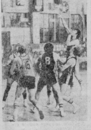
4 ТОШКЕНТ БОСМАХОНА