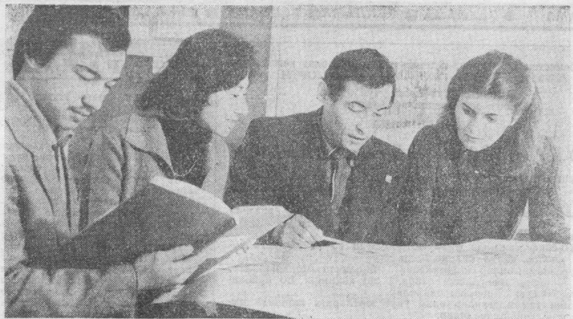
Забонистон маданият ёлгорликларни тиклаш ва таъмирлаш илмий-тадқиқот институтининг ходимлари қадимий ёлгорликларни реставрация қилиш бўйича натта ҳажмидаги ишларни амалга оширишмоқдалар. Шу институтнинг 2-пийви устакхонаси мезморлари шу кунларда шаҳримиздаги Юнусов ва Шайх Хованди Тоҳур маъбарларини таъмирлаш лойиҳаларини тайёрлашмоқда.