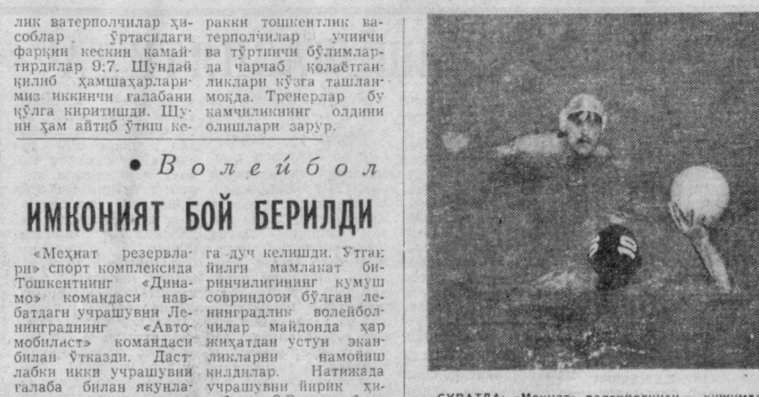
Улар биринчи ва иккинчи бўлимда рақибларнинг дарвозасига беш марта тўп киритиб, ўз дарвозаларидан фақат икки марта тўп ўтказиб юбордилар. Учинчи бўлимда ҳам ҳаммаҳарларимиз ўзукморийликка эъришилди. Натижада улар ҳисоби 8:3 та етиказишга муваффақ бўдилар. Тўртинчи бўлимда эса тошкентлик ватерполчилар ҳотиржамликка берилганликлари тўғайли аҳвол бутундай ўзгарди. Улар тез-тез хатога йўл қилишиб, кўп вақт зағор майдонда камчилар қилишди. Қулай имкониятлардан фойдаланган мински ватерполчилар ҳақиратларини қанчалар камгайиб қилишди. Шундай қилиб ҳаммаҳарларимиз йилга киритишди. Шунинг ҳам айтиб ўтиш керакки тошкентлик ватерполчилар учинчи ва тўртинчи бўлимларда чарчаб қолаётганликларни қўлга ташлашмоқда. Тренерлар бу камчилигининг олдин олишлари зарур.