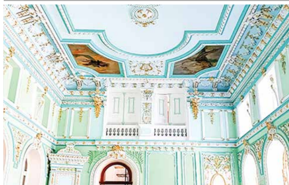
Интерьер конференц зала после восстановления

устройством и оздоровлением ее исторической части. Особенно это актуально при крупномасштабной реконструкции, где необходимо учитывать их исторический статус и национальные традиции.