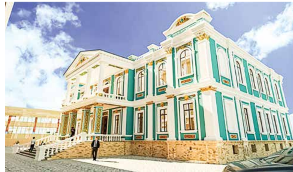
Фасад Русско-Китайского банка после реставрации

С позиции архитектуры, эта пристройка не имеет никакой архитектурной эстетической ценности. Новое здание было построено без учёта значимости архитектурного облика и особенностей бульвара. Она полностью перекрыла изящный фа-