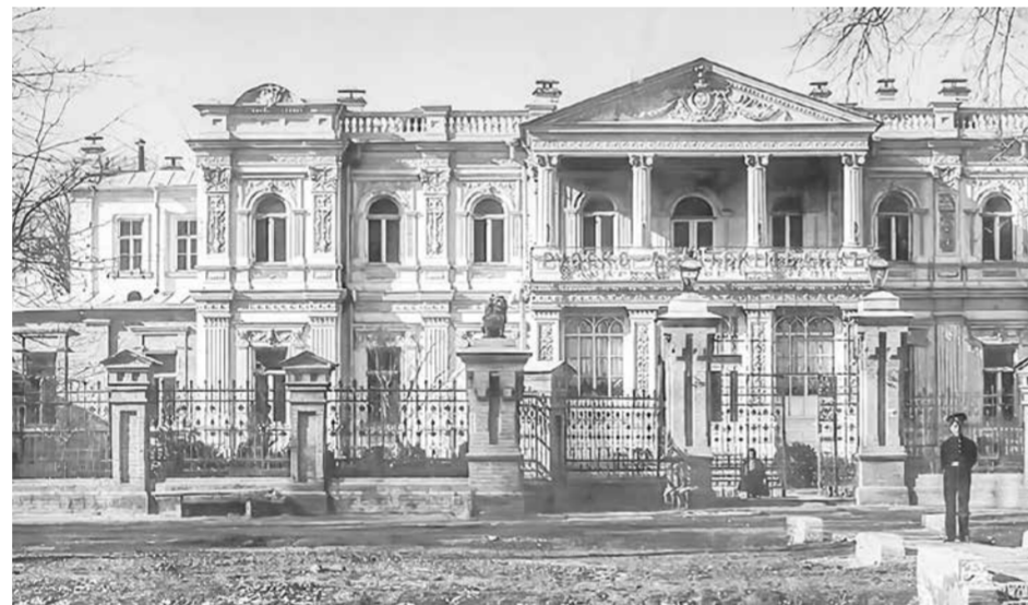
Русско-Китайский банк, фотография конца XIX века