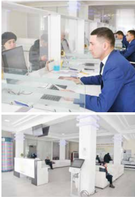
Суратларда: Бағдод туман давлат хизматлари марказида.

Фаргона вилояти Бағдод туманида 203 минг аҳоли инстикомат қилади. Айни кунларда туманда 3 минга яқин тадбиркорлик субъектлари фаолият кўрсатмоқда. Туманда сўнгги икки йилда 2 мингдан ортиқ янги иш ўрни яратилди.