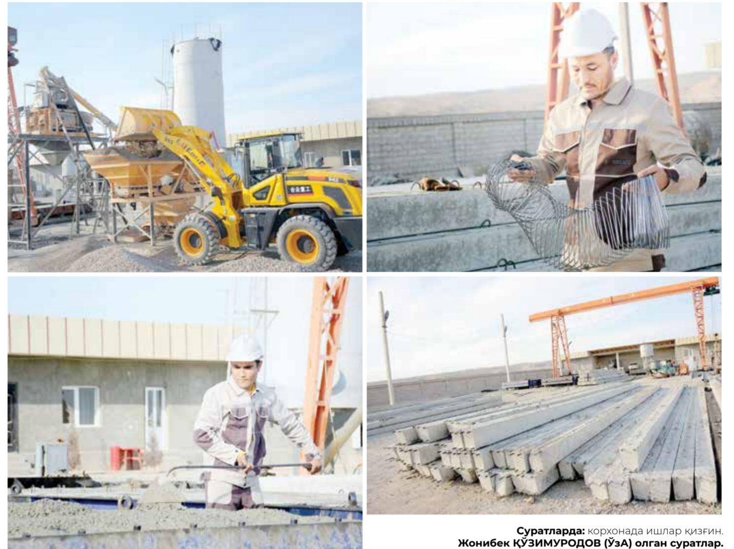
Суратларда: корхонада ишлаб чиқариш. Жонибек ҚЎЗИМУРОДОВ (ЎЗА) олган суратлар.

Бағдод туман давлат хизматлари маркази 2021 йил давомида тадбиркорлар ва фуқароларга 80 мингдан ортиқ давлат хизматлари кўрсатди. Жорий йилнинг мос даврида эса 160 дан ортиқ хизматлар бўйича 4 минг 890 та давлат хизматлари аҳолига тақдим этилди.