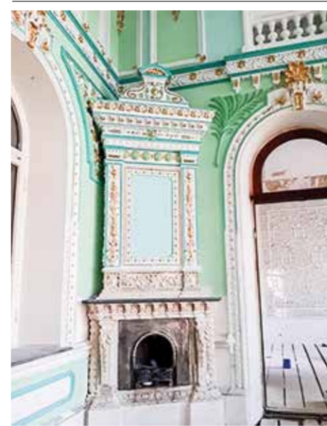
Фрагмент камня и детали карниза в интерьере конференц зала

сад исторического здания банка. Кроме того после завершения строительства 4-х этажного корпуса были проведены планировочные работы, весь строительный мусор вокруг исторического здания банка оставили на территории и его распланировали, что повысило уровень планировочной отметки на западной части территории банка на один метр.