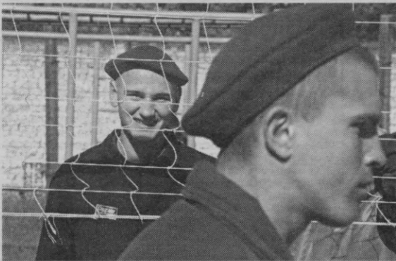
(Давоми. Бошланғичи 1-бетда).

Амнистия ўз ижтимоий муҳитига кўра, муайян жиноятларни содир этган шахсларнинг айрим тоифасига тааллуқли бўлади. Суд ҳукми асосида жазо тайинланган шахс амнистия акти ёки авф этиш асосида асосий ва ижро этилмаган қўшимча жазолардан озод қилиниши ёки унга тайинланган жазонинг ўталмай қолган қисми енгилроқ жазо билан алмаштирилиши мумкин. Содир этилган жиноятларга нисбатан жазолов функциясини йўқотмаган ҳолда амнистия акти асосида жазо қисман ёки тўлиқ бекор қилинади, бошқа енгилроқ тури билан алмаштирилади ёхуд қўзғатилган жиноят иши тугатилади. Жиноий жазодан озод қили-