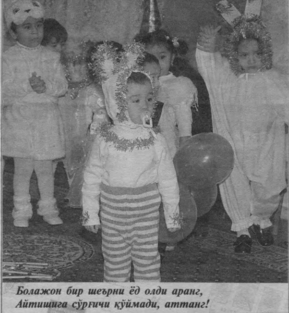
Болажон бир шеърни ёд олди аранг, Айтишига сўргичи қўймади, атманг!

ишининг орқага суриб келинаётгани тўғрисида шижоат қилган эди. Қашқадарё вилоят прокуратураси томонидан ушбу аризадаги важлар текшириб кўрилганда аризадаги Ҳўжаҳурросон ҚўЙ га тақдим этилиши лозим бўлган ҳўжатларни, яъни ариза берган вақтга қадар 12 ойлик даромадлари тўғрисидаги маълумотномани, 3-гурўх ногиронлиги учун туман иқтимоий таъминот бўлимидан 12 ой давомида олган ногиронлик пенсия пули тўғрисидаги ҳамда турмуш ўртоғининг ишсизлигининг тасдиқловчи маълумотномани қўшимча равишда тақдим этмаганлиги аниқ-