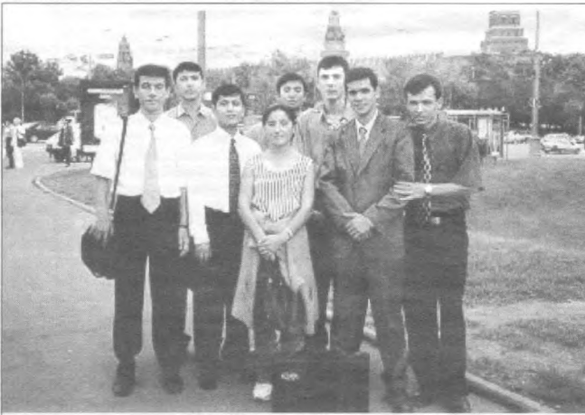
«Умид» жамғармаси йўланмаси билан хоризда таҳсил олаётган бир гуруҳ ўзбекистонлик талаба-ёшлар.

миз», «Усмир ва қонун» каби мавзуларда бахш-мунозаралар, йигилишлар, кечалар, конференция ва семинарлар ўтказилиб, бунда республикамизнинг таниқли фан ва маданият арбоблари, жамоатчилик вакиллари, шоир ва ёзувчилар тақлиф қилиниши одатий ҳолга айланиб қолди. Бизнингча, бундай тадбирларни бутун республикамиз