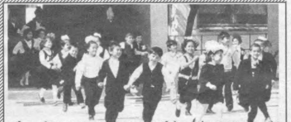
«Фарзандлар ота-оналаринг наса-насабидан ва фуқаролик ҳолатидан ҳатий назар, қонун олоиди тегибдилар. Оналик ва болалик давлат томонидан муҳофаза қилинади». Ўзбекистон Республикаси Конституциясининг 65-моддаси.

Халқимизни ижтимоий ҳимоя қилишга қаратилган бу фармоннинг ижроси биз прокуратура ходимлари зиммасига қатта масъулият юклайди. Давлатимиз томонидан ажратилган маблағлар ўз эгаларига етиб бориши керак.