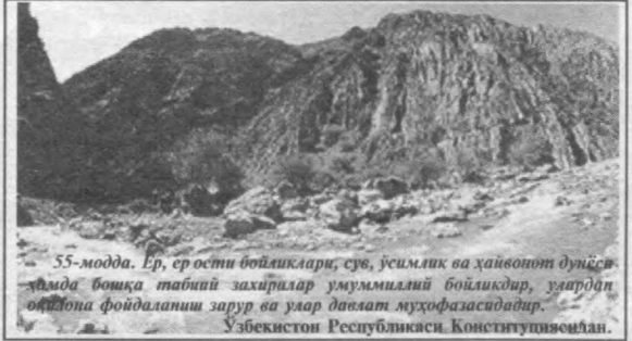
55-модда. Ер, ер ости бойликлари, сув, усимлик ва ҳайвонот дунёси ҳақида бошқа табиий захиралар умумийлиги бойлиқдир, улардан фойдаланиш зарур ва улар давлат муҳофазасидадир. Ўзбекистон Республикаси Конституцияси.

Бунда фансдорларга энг кам иш ҳақининг беш бараваридан ўн бараваригача, мансабдор шахсларга эса ўн бараваридан ўн беш бараваригача жарима солиниши мумкин.