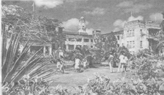
Тайланд. Сайёҳлик масканларидан бири.

Ҳиндлар ва мусулмонлар ўртасида тўқнашувлар бўлиб турган Ҳиндистоннинг Гужарат штатида полиция оломонни тарқатиш учун ўқотар қуролдан фойдаланди. Оломон Аҳмадобод шаҳри яқинидаги икки биноға ўт кўйишға урингани туфайли ҳарбийлар ўт очишға мажбур бўлди, дея вазиятни изоҳлаган Ҳиндистон полицияси вакили. Натижада икки киши ҳалок бўлган. Айни кунгача тўқнашувларда қурбон бўлганларнинг умумий сони 500 кишидан ошиб кетди.