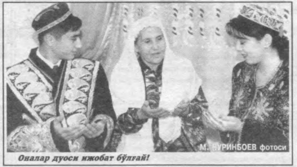
Оналар дуоси ижобат бўлмай!