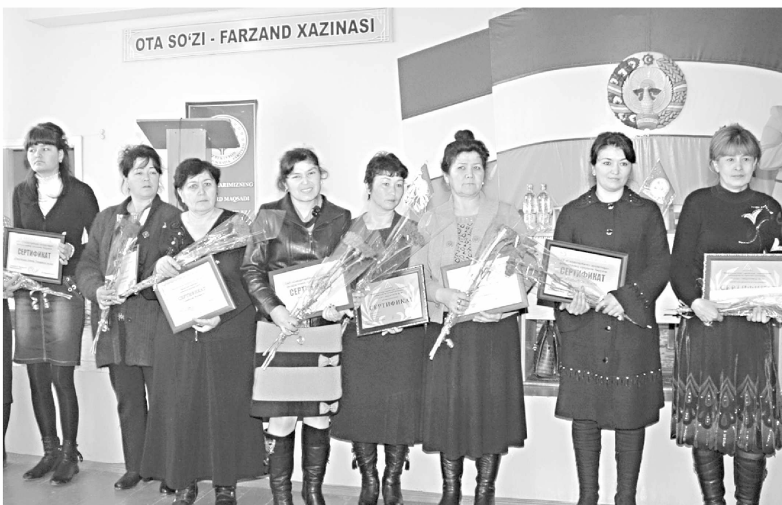
га ёрдам беришга доим тайёрмиз.

Шунинг учун ҳамкорликдаги тадбирларимизни кенг қамровли ўтказишга эътибор бериб келаямиз. Тадбир доирасида ташкил этилган тижорат банкларининг микрооливи хизматлари бўйича кўргазмаси, ҳудудий ишлаб чиқарувчилар, оилавий тадбиркорлар ва хунармандларнинг маҳсулотлари намойиши шу мақсадга қаратилди.