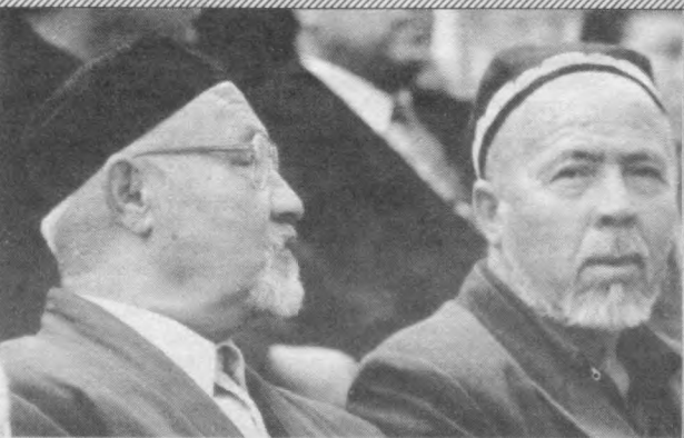
Қарияларимиз — қадриятларимиз