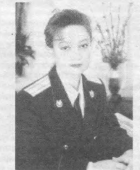
Сад ва вазифалари ҳақида нималар дейсиз?

ҳуқуқат қарорлари билан мунтазам равишда таништириб борилади. Прокурорларнинг малакасини оширишга қаратилган бир мунча ишлар амалга оширилди. Бош прокуратуранинг бўлим ҳамда бошқарма бошлиқлари ва тажрибали ҳодимлари билан ҳамкорликда ҳуқуқ-тартиботига бағишлаб ўтказилган қўлаб тадбирларимиз ижобий натижалар бермоқда. Шунингдек, бўлим фаолиятидан келиб чиқиб, қонунчилик ва ҳуқуқ тартиботини кучайтириш, фуқаролар қонуний меъфалларини ҳимоя қилиш, давлат бошқарувининг демократик принципларини мустаҳкамлаш, жамиятда ҳуқуқий маданиятни шакллантириш ва шу орқали фуқароларда қонуний ҳурмат, ҳуқуқий меъёрларнинг бузилишига муросасизлик руҳини қарор топтириш борасида жойларда тартибот ишларини жонлантириш масалаларига ҳам алоҳида эътибор бермоқдамиз.