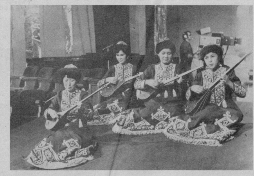
СУРАТДА: «Қирқ қиз» дуторчилар халқ ансамбли куй ижро этмоқда.