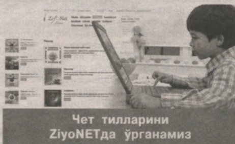
Чет тилларини Ziyonetда ўрганимиз

Шундай даврда яшашимизки, хорижий тилларни билишнинг аҳамияти ҳақида гапиришнинг ўзи ортиқча. Бу борада Ziyonet порталида тилларни ўрганиш бўйича интерфаол усуллардаги хилма-хил шакл ва воситалар тақдим этиляпти.