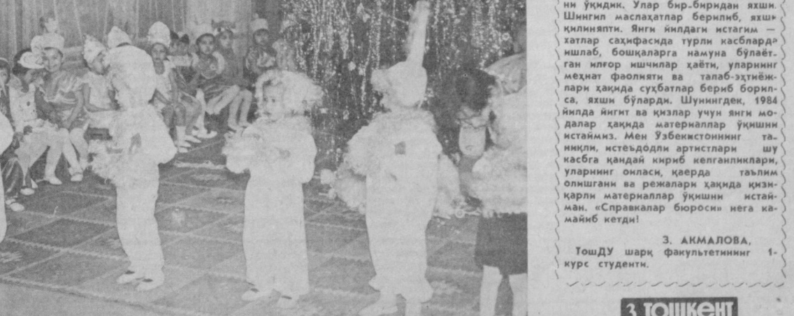
СУРАТДА: Янги боғчада Янги йил бай-рами.