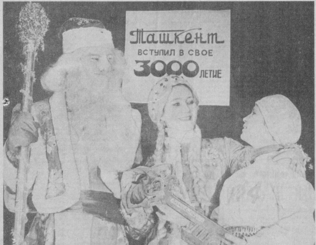
Тошкентнинг уч мингинчи йили калитини қабул эт, Янги йил!

СУРАТДА: Беруний проспектида фойдаланишга топширилган ана шу уйнинг ташқи кўрinishи.