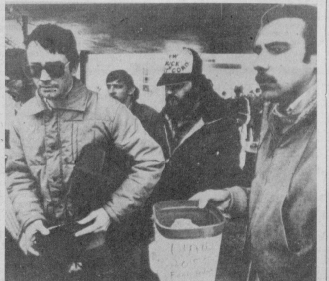
АҚШда ишсизлик тобора ошиб борапти. Рейган маъмурияти эса миллионлаб оддий америкаликларни ҳал, нон ва уй билан таъминлашни уйламапти ва бунинг истамаяпти ҳам.

гация станциялари ва «В-52» тинидаги стратегик бомбардировчи самолётларини оқимда ёниги билан қўшимча таъминлайдиган ва бу ерда жойлашган авиация бўлимлари шундай объектлар жумласидандир. Умуман, Окинава Осиё регионинда Америка ядровий қучларининг команди постига айлантирилган, деб таъкидланди симпозиумда.