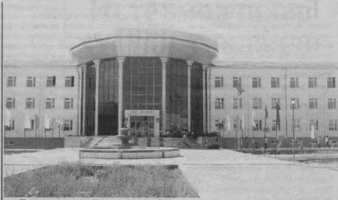
Қорақалпоғистон ёшлари ана шундай замонавий коллежларда таълим олади.

қарши курашни кучайтириш чора-тадбирлари тўғрисида»ги қароридан юклатилган вазифаларни бажариш мақсадида бир қанча ишлар амалга оширилмоқда. Ўтган давр мобайнида ўтказилган 150 та текширувлар натижасида 124 та жиноят иши, 52 та маъмурий иш қўзғатилди. Масалан, Тўрткўл туманида жойлашган «Бўстон Элтўртқалъа» МЧЖ мансабдор шахслари томонидан харидориги ва тез сотиладиган маҳсулотларни сотишдан тушган 32 млн. 880 минг сўм нақд пул банкга топширилмаганлиги аниқланган.