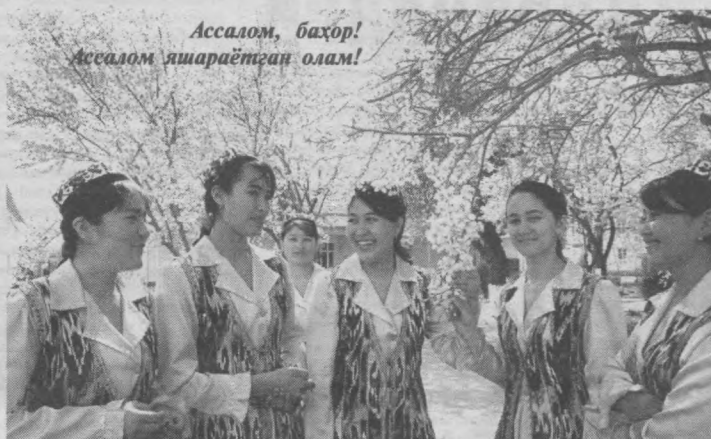
Ассалом, баҳор! Ассалом яшарётган олам!

Кишини хазратонига дош бериб, мудрок уйкуга кетган она-замин кайта жонланиб, ўлка-мизга фасллар келинчаги бахор ташриф буюрди. Серкўёш диёримизга истиқлолнинг порлок кунларини ваъда этиб, она-заминимизни яшил майсаларга, ранго-ранг чечакларга буркаб, ниҳолларга гул-исирга тақиб келди у. Бодом кийгос гулга кирган, бойчечак буй кўрсатганига эса анча бўлди. Юртимизда яна бахор нафаси уфурмоқда.