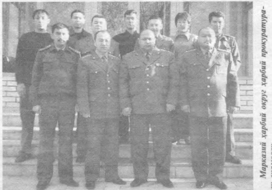
Марказий ҳарбий округ прокуратураси жамоаси

Жумладан, Сурхондарё вилоят мудофаа ишлари бошқармасида ўтказилган текширишда бошқарма молия ва моддий-техника таъминоти бўлимида бошлиғи Х.Қариёвнинг 2.813.600 сўмлик мол-мулк-