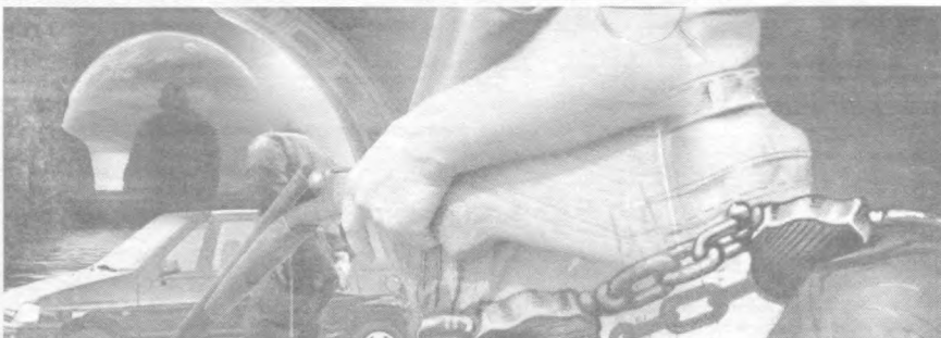
«Биллард шарчаларини тасаввур қил, уни қий билан туртишинг билан ҳаммаси тирқираб кетади. Сен мўлжалга олган шарларга, стол деворларига туртилиш ва урилишларис амалга ошмайди. Инсоннинг умр йўлини ҳам тақдир зарбаларис тасаввур қилиб бўлмайди. Ҳаётингдаги зарбалар ва туртилишлар сени ўзинг кутмаган жойларга йўллашига ишонавер...» (Мулло Насифнинг «Графга насиҳати»дан)

— Бировга айтсанг башарани кесиб кетаман, тушундингми? — дўқ қилди у. Оғайни, у чўнтаккесарлик қилаётганидан мендан нима учун унчалик қўрқмаганига ҳайрон бўлгандим. Сўзга саклаб олган дўқдан унчалик қўрқмаганимнинг аниқлиги сезилди. У чўнтағимга бир даста пулни тиқиб қўйди ва бир нарсга дейишга улгурмасидан йўлиб бўлди. Йўлда кетар эканман, ўзимча чўнтағимдаги пулга қизиқдим. Санаб кўрсам бу пулни ҳаммоллик қилиб уч ойда топшим мумкин экан. Эртасига пулни унга қайтариб бермоқчи бўлдим. Кўнглим хижил бўлиб ўгай ақинашар эканман, остонада бир пайтлар итнинг катагига қамалишимга сабабчи бўлган таниш башарани кўриб қотиб қолдим. У беамол отам билан суқбатлашиб турар, қўлида эса эски брезентга ўралган нимадир бор эди. У мен билан хотиржам қўришди. Шунда унинг оғиздаги сарик тишлар яттираб кетди. Отам унинг ўгай онам билан қилиб юрган ишларидан беҳабарлиги тобора жаҳилими чиқарди. Улар бир гаилда халлиги нарсага олиб ҳолатхонага томон юришди. Брезентни очинганида унинг ичидagi қўрқма миллияқа қўзим тушди. Ёнида тўрт-беш кути ўқ ҳам бор эди. Буларни пакетга ўрашди ва ҳолатхонага ташлаб юборишди. У бетамиз ўгай тез-тез келиб турадиган бўлди. Бу орада қиссаворга шогирд тушиб қолганимни ўзим ҳам билимай қолдим. У менни шўфатсизликка ўргатди. Дўйдан қотиб, уйимизга келадиган ўша бетамизга нисбатан нафрат