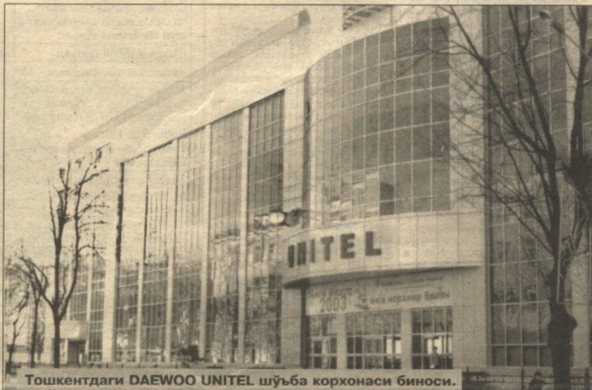
Тошкентдаги DAEWOO UNITEL шўъба корхонаси биноси.