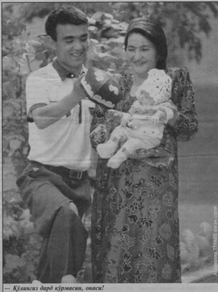
— Қўлингиз дард кўрмасин, онаси!

Суратда: Йиғилишдан лавҳа.