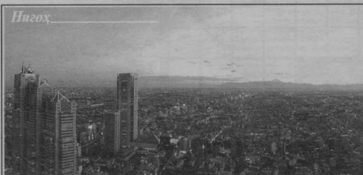
Япония. Кунчиқар юрт манзаралари

Маҳмуд Аббос шахси ўзида энг тинчликсевар ва мурасосоз фаластинликни жамлаган. Утган йил охирида у Исроил томони билан музокара ўтказиш ташаббуси билан чиққан эди. Аббос ватанида машҳурликда Арофатдан қолишмайди. Айниқса уни ФАТХчилар қўллаб-қувватлашди, гарчи Арофат мазкур партия раҳбари бўлса-да. Экспертлар унинг Бош вазир лавозимига тайинланишида ҳам айнан шу партия мўҳим рол ўйнаганини таъкидлашмоқда.