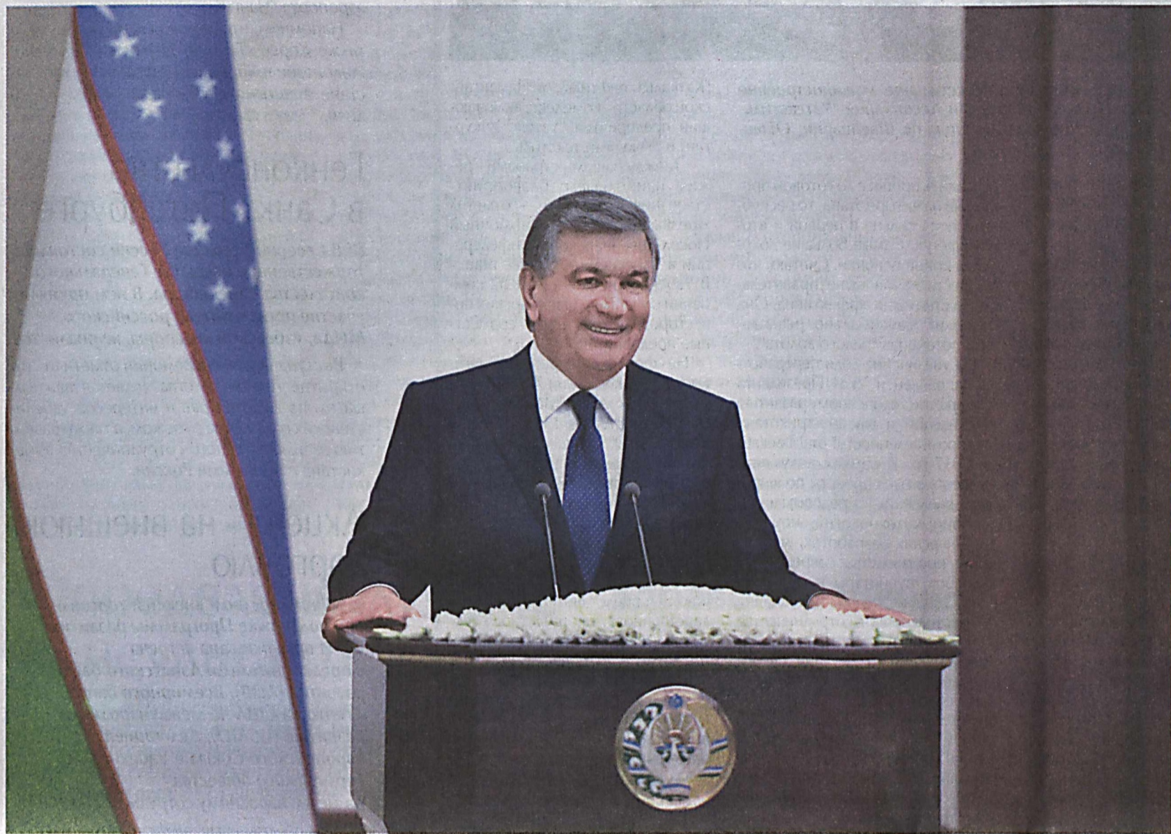
Президент Республики Узбекистан Шавкат Мирзиёев в целях ознакомления с ходом социально-экономических реформ, осуществляемой созидательной и благоустроительной работой, новыми проектами на местах, для диалога с народом 17 марта прибыл в Самаркандскую область.

Самаркандская область имеет высокий экономический потенциал, богатую историю и культуру. Осуществляемые сегодня по всей стране широкомасштабные реформы во всех сферах с каждым днем обновляют социально-экономическую жизнь области, что находит свое воплощение в благоустройстве городов и сел, росте благосостояния населения.