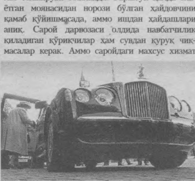
ҳодимлари ҳар қанча уринмасин, сарой ҳаёти тафсилотлари барибир газеталар юзини қўриб туради. Бунда газетачиларга асосан хизматкорлар ёрдамга келишади. Улар шу йўл билан "қўшимча даромад" олиша керак. Бир неча ой муқаддам қимматбахо гилам устига тўкилиб кетган чой тўғрисидаги хабар бир неча соатдан кейин "сарик матбуот" саҳифаларида эълон қилинганди. Шахзодалар Чарльз, Уильям ва Гарриларнинг қароргоҳида Уильямнинг севгили Кейт Миддлтон учун спорт зали бўиёд қилинганда, Кларенс-хаусда чоп этиладиган The Kaily Mail газетаси нимжонгина Кейт қандай шахзодаларга спорт машқларини қандай бажариб қараклигини ўргатаётганлиги хусусидаги хабарни қўшиб-чатиб, бўиб-бежаб эълон қилганди. Баъзида эса мухбирларнинг ўзлари ҳам хизматкор сифатида ишта ўрнаниб олиб, кейин қўрган-кечирганларини "журналист касбини ўзгартиради" рубрикаси остида эълон қилишади. Масалан, 2003 йилда Kaily Mitog мухбири саройга ишта кириб олган, бир неча ой ишлаган, сўнгра бошдан ўтказатиларини мақолада баён этган. Унинг ёзишича, ўша пайтда қиролчиликнинг меҳмон бўлиб келган Жорж Буш ёки бошқа бир юқори мансабли жанобга ҳужум қилиш унинг учун жуда осон иш бўлган. 2006 йилда эса News of the World газетаси мухбири уй хизматчиси ёрдамчиси лавозимига ишта кириб олиша уринганда қамқоққа олинган. Мухбир қизининг қамқоққа олинганлигини Британия хуфия хизматининг қатта ютуғи сифатида баҳолаб, оламга жар солишди. Мухбирларнинг ўзлари эса бундай "саройга кириб олишни" қиролчиликнинг хавфсизлигини таъминлаш учун ҳаракат деб баҳолайдилар. Бу гап бир томондан тўғри - саройдаги турли майда-чуйда қамчиликларни террористлардан қўра мамлакат журналистлари қўрганлари маъқулоқ. Газетага ёзадими, радио ёки телевиденида чиқиб қилади, барибир оқибатда ўша қамчиликлар тугатилди. Ҳаммаси яхши-ку, аммо сарик матбуотнинг турли олди-қочди гаплар ортидан қувиб, миллион-миллион пул ишлаши яхши ниятларини сойда қолдириб кетди-да.

► Ўшанда Игорни Англияда бўлиша имкон берадиган визаси (руҳсатномаси) мuddати тугатгани учун ишдан бўшатандилар. Иш нуқтаи назарида унга ҳеч қандай шикоят билдирилмаган ҳамда ҳужжатларини қайта расмийлаштиригандан кейин ишта қайтиши мумкинлигини айтишган. Ҳолованов ҳам ўз навабтида қиролчи оиласининг сир-асордларини оғиздан гулламаган. Сирджихон қандай йўллар билан қиролчи саройига ишта жойлашиб олганлигини ҳам "бойваччаларга" оғиздан гуллаб қўйган экан. Мухбирлар Брайннинг гапларига асосланган ҳолда ёшларича, барча хайдовчилар совик харбий хизматчилар экан. Унинг ўзи армиядан истефого чиққач, түрт йил давомида махсус тайёргарликдан ўтган, яъни шахзода Эдуард ва унинг рафиқаси Катарина Уорсли хонининг хос хайдовчиси бўлган. Брайн уйлганан, аммо Викторига эмас. Шунга асосланган ҳолда мухбирлар хайдовчининг сукуоёқ Викторига билан алоқда бўлиши уни одамларни дўқ-пўтиса билан қўрқитиб ўз йўлларига соладиган товламачиларга ишон қилиб қўйиши мумкин, деб ҳулоа қилдилар.