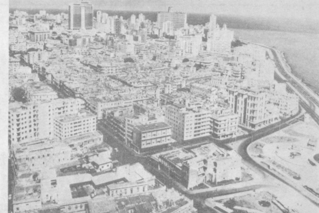
Куба республикаси пойтахти — Гаванада янги кватралар сон тобора ортиб бормоқда. СУРАТДА: Гавана панорамаси.

БУДАПЕШТ. Секефхерварда «Ёзлик университет» очилди. Университет тингловчилари — ўқитувчилар, ҳисоблаш техникаси мутахассислари, маориф системасининг ходимлари бир hafta мобайнида мактаблардаги ўқув жараёнида электрон ҳисоб машиналарини қўлланиш тажрибаси ва имкониятлари билан танишдилар. Венгрия Социалистик мамлакатлари орасида ҳисоб машиналарини қўллаш ва програмалашни мураккаб