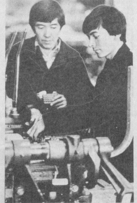
СССР 50 йиллиги номи «Тошкент трактор заводи» ишлаб чиқариш бирлашмаси меҳнатчилари социалистик мусобақанинг бош бандларини муваффақият билан бажаришмоқда. Жумладан, улар қабул қилинган шартнома бўйича 100 процент маҳсулот этилаб беришга эришгилар.

Бизнинг республикамиз бу кўриқда бир неча бор машинасозлик, соғма буюмлари сингари маҳсулотларини намойиш қила олган. Бу йилги кўриқда эса зияратчилар биринчи марта чоғи қарақўла очилган турган гўза тулпарини кўридилар. Улар орасида «Работ», «Тошкент», «С—2606», «С—6057» ва бошқа патта навларини, пахтанинг «Анджон—2», «Термиз — 7» навлари уруғлигини кўридилар. Ўзбекистонга юборилган маҳсулотларни тайёрлаш