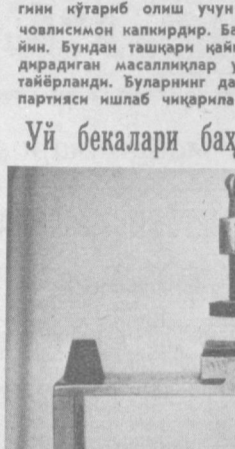
Уй бекалари баҳолашади