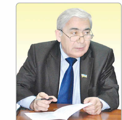
Комил ОЧИЛОВ, Олий Мажлис Қонунчилик палатаси депутаты, ЎзХДП фракцияси аъзоси

Ҳуқуқий таълим ва маърифатни, жамиятда ҳуқуқий билимлар тарғиботини тубдан яхшилашга қаратилган мақсадли чора-тадбирлар дастурини ишлаб чиқиш так-