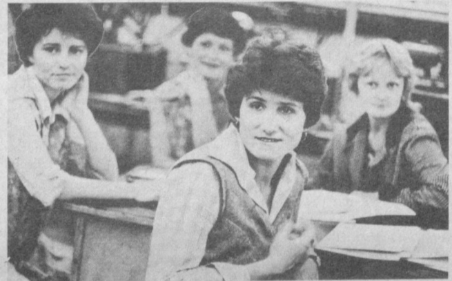
«Мелодия» Бутунитти-фок Фирмасининг Тошкентдаги трамплинликлар заводига тайёрланаётган маҳсулотлар бугунги кунда 800 тилдан ошиб кетди. Биринчи квартал якулига қўра завод коллективининг биринчи ўринини эгаллаб,

«Ташсельмаш» заводи бир йилда 70 минг сўмликдан зиёд иқтисодий фойда олади. Шу билан бир қаторда корхонада шпинделларни тайёрлаш жараёнини тўла автоматлаштириш учун зарур тадбирлар белгиланмоқда. Йил охиригача бу ерда яна тўртта унумли автоматни ишлаб чиқаришга жорий этиш мўлжалланган.