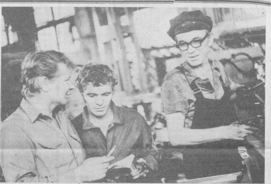
Тошкентдаги «Геологразведка» заводи халқ назоратчилари меҳнат унумдорлигини ошириш, махсулот сифатини муштаҳамлаш, махсулот сифатини яхшилаш, моддий ва ёқилги-энергия ресурсларини тежаш борасида кўп иш қилишяпти.