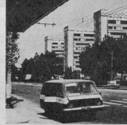
Пойтахтдаги Тошкентнинг бугунги кун — ривожланган социалистик жамиятга хос бўлган шаҳар тисмонини беради. СУРАТДА: Богдан Хмельницкий кўчасидаги янги турар жой бинолари комплекси.