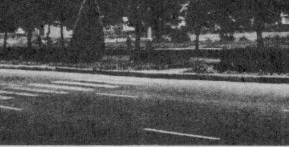
Пойтахтдаги Тошкентнинг бугунги кун — ривожланган социалистик жамиятга хос бўлган шаҳар тисмонини беради. СУРАТДА: Богдан Хмельницкий кўчасидаги янги турар жой бинолари комплекси.