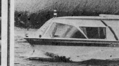
Касселадаги (ГФР) кема верфида қуруқликка чиқанда автопринципга айлантирилган оригинал тран спорт воситаси — қайик (суратда) яратилди.

«Қизил тон» АҚШ-да чиқарилган ҳамда Совет Иттифоқи ва бошқа социалистик мамлакатларни қора-лайдиган, СССР сие-сатининг моҳитини қўпол бузиб кўрса-та-