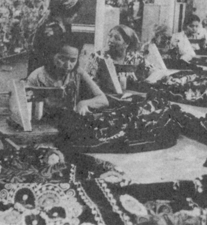
Бадний буюмлар фабрикаси коллективининг республикамиз учун қўлуғи йилда элга манзур миллий бадний буюмлар тайёрлаш борасида юксак кўрсаткичларини қўлга киритмоқда. Корхона коллективни юбилей йили мажбуриятини муваф-фақиятли бажарди. 200 минг сўмлик маҳсулот юксак сифат билан тайёрланди.

Касба союз комитети бригадаларнинг ик-жодий активлигини ошириш мақсадида со-циалистик мусобақа шартларига аянагина ўзгалтиришга киритди.