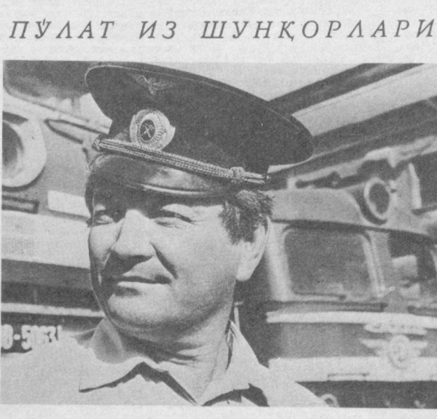
ПУЛАТ ИЗ ШУНҚОРЛАРИ