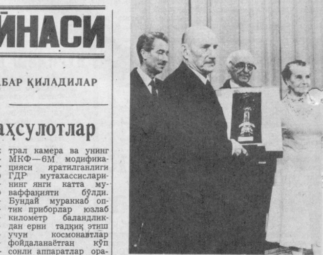
СССР. Режиссёр С. Герасимовнинг «Лев Толстой» фильми Чехословакиянинг Карловы Вары шаҳрида бўлиб ўтган халқаро кинофестивалида беш соғирин — «Биларуси глобусин» олишга сазовор бўлди. СУРАТДА: С. Герасимов фестивал муюкофоти билан.

МНФ—6 кўп спек-трал камера ва унинг МКФ—6М модифика-цияси яратилганлиги ГДР мутахассислари-нинг янги катта му-ваффақияти бўлди. Бундай мураккаб оп-тик приборлар юзлаб километр баландлик-дан ери талқи этиш учун космонавтлар кўп сонли аппаратлар ора-сида муваффақан ўри-ни эгаллади. Ана шу камералар ёрдамида ернинг айрим райо-нларининг фотосурат-лари қардош мамлакат-лар халқ ҳўжалиғи кўпгина тармоқлари-нинг мутахассислари-га планетамиз тўғри-сида янги маълумот-лар беради.