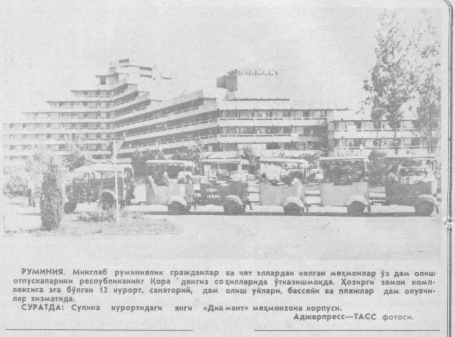
РУМИНИЯ. Минглаб руминиялик граждандар ва чет эллардан келган меҳмонлар ўз дам олиш отпускарининг республикадаги Қора дегиз соҳилларида ўтказишмоқда. Қозирги замон комплексида эга бўлган 12 курорт, санаторий, дам олиш уйлари, бассейн ва пляжлар дам олиувчилар хизматига.

БРАТИСЛАВА. Словакиянинг Мартин шаҳрида очилган виставка «Совет китоби тинчлик ва тараққиёт хизматлари» деб аталган. Виставкани республикада СССР нашриётларининг махсуслотларини оммалаштириш билан шугулланувчи «Словакия китоби» бирлашмаси ташкил этган. Виставкада 600 дан кўпроқ экспонат — иккинчи даражадаги адабиёт, Улуғ Ватан урушига бағишланган китоблар, журналлар, шунингдек, Чехословакия авторларининг Совет Иттифоқига рус тилида нашр этилган асарлари намойиш қилинмоқда.