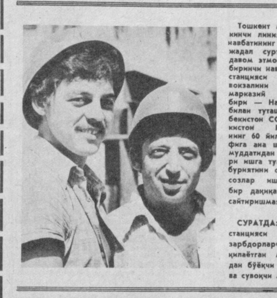
Тошкент метроси иккинчи линиясини биринчи навбатининг қурилиш мақсади сурьатлар билан давом этмоқда. Ана шу биринчи навбатининг беш ставкасини темир йўл вокзалини шавтернинг марказий йўналишдан бири — Навоий кўчаси билан туташтирди. Ўзбекистон ССР ва Ўзбекистон Компартиясининг 60 йиллиги шарафига ана шу ўлканинг мунтазам 14 оқ йилга ишга тушириш мажбуриятини олган метросозлар иш сурьатини бир дақиқига ҳам сусайтирмайпти.

ВЛКСМ Марказий Комитетида пассажир транспорти корхоналариди комсомол ташкилотларининг фаолиятини кучайтриш тавсия қилинди. Бу корхоналарга ишчиларни комсомол йўлдамлари билан юбориш, транспортдаги касбларни эгаллашда уларга ёрдам бериш лозим.