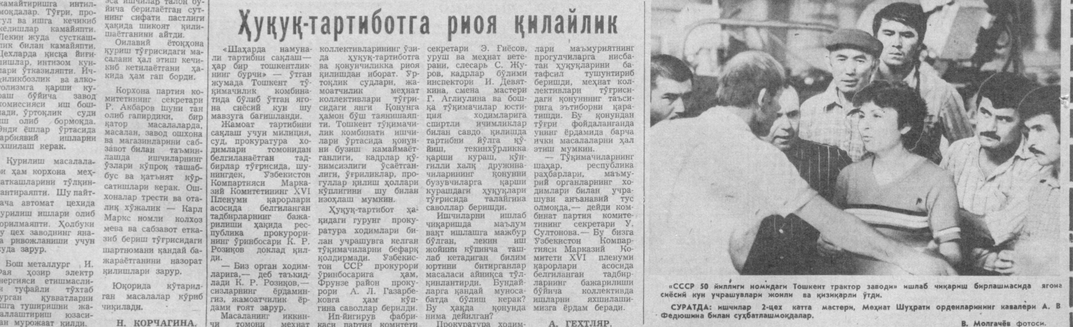
«СССР 50 йиллиги номидеги Тошкент трактор заводи» ишлаб чиқариш бирлашмасида ягона сиёсий кун учрашувлари жонли ва қизиқарли ўтди.

Ягона сиёсий кун жараёнида нотик йиғилганларни қизиқтирган кўпгина саволларга жавоб берди. Сўзининг сўнгида у «Ўзбекистон» депоси ходимларининг мурожаатини ўқиб берди. Бу мурожаатда ягона сиёсий кун мавзуси билан боғлиқ масалаларга алоҳида эътибор берилган эди.