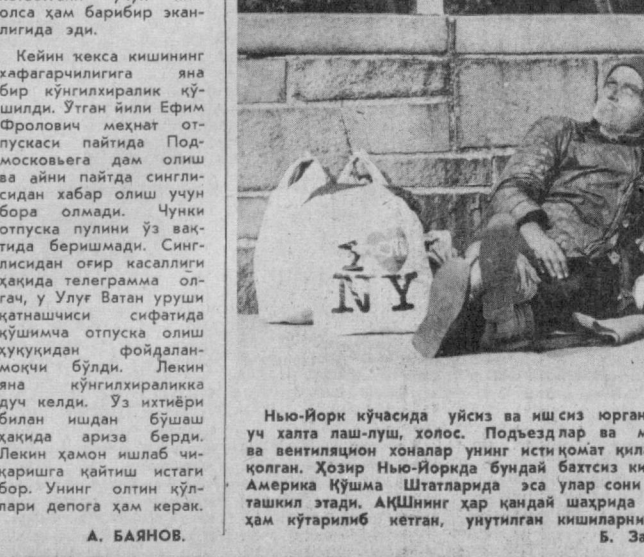
Нью-Йорк кўчасида уйсиз ва ишсиз юрган бу одамнинг ишонгани уч халта лаш-луш, холос. Подъездлар ва метрополитен станциялари ва вентилацион хоналар унинг исти қомат қилганда жойларига айланиб қолган. Ҳозир Нью-Йоркда бундай бахтсиз кишилар 60 мион нафардир. Америка Қўшма Штатларида эса улар сонин салкам 3 миллион кишини ташкил этади. АҚШнинг ҳар қандай шаҳрида ушбу йималлик ёвдан ҳам кўтарилмаб кетган, унутилган кишиларни қўлаб учратиш мумкин.