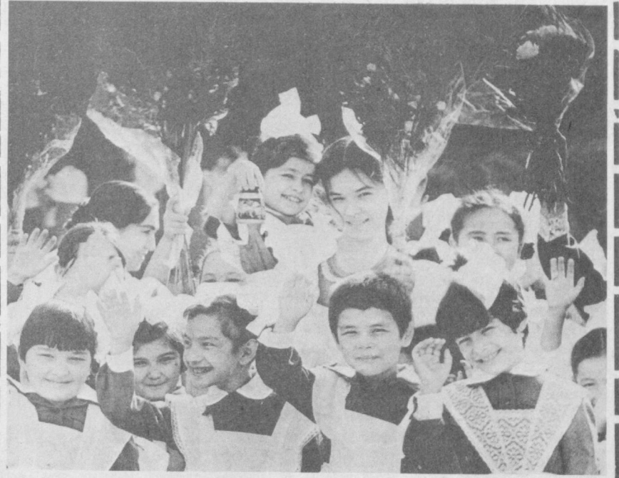
«ЭРТАГА МАКТАБГА БОРАМИЗ».