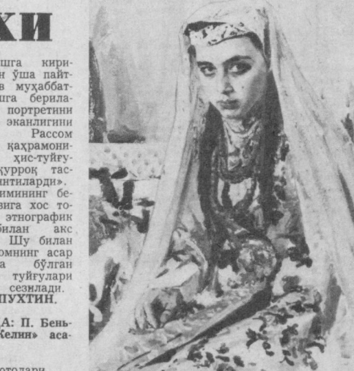
Суратда: П. Беньковнинг «Келин» асари.