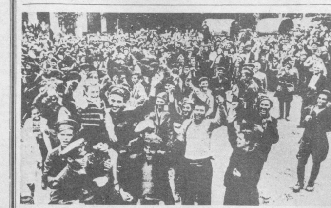
София аҳолиси ўз ҳалоскорларни — Совет Армияси жангчиларини ва болгалар партизанларини қўламоқда.

Фалай ТЭСи — Совет-Вьетнам иттифоқидан қўрилган Фалай ТЭСи вьетнамлик йигит ва қизлар учун профессионал устуқлиқ мактабига эришти.