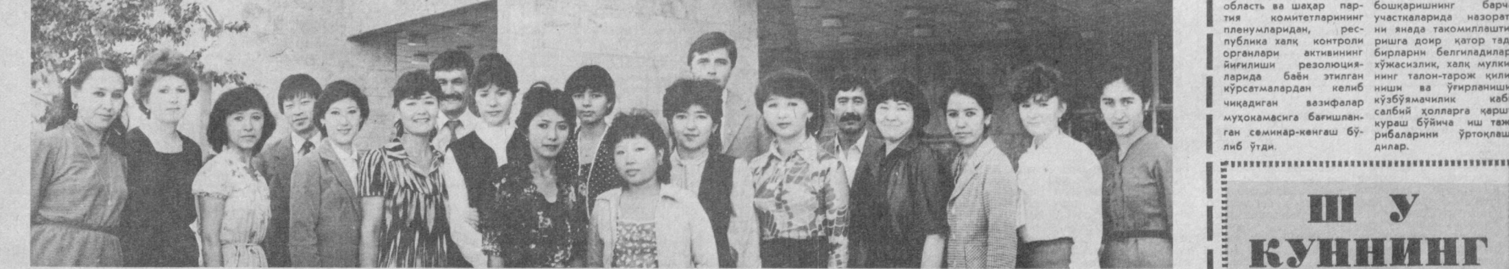
СУРАТДА: ташаббускорлар — 1-шаҳар клиник касалхонасининг комсомоллари.