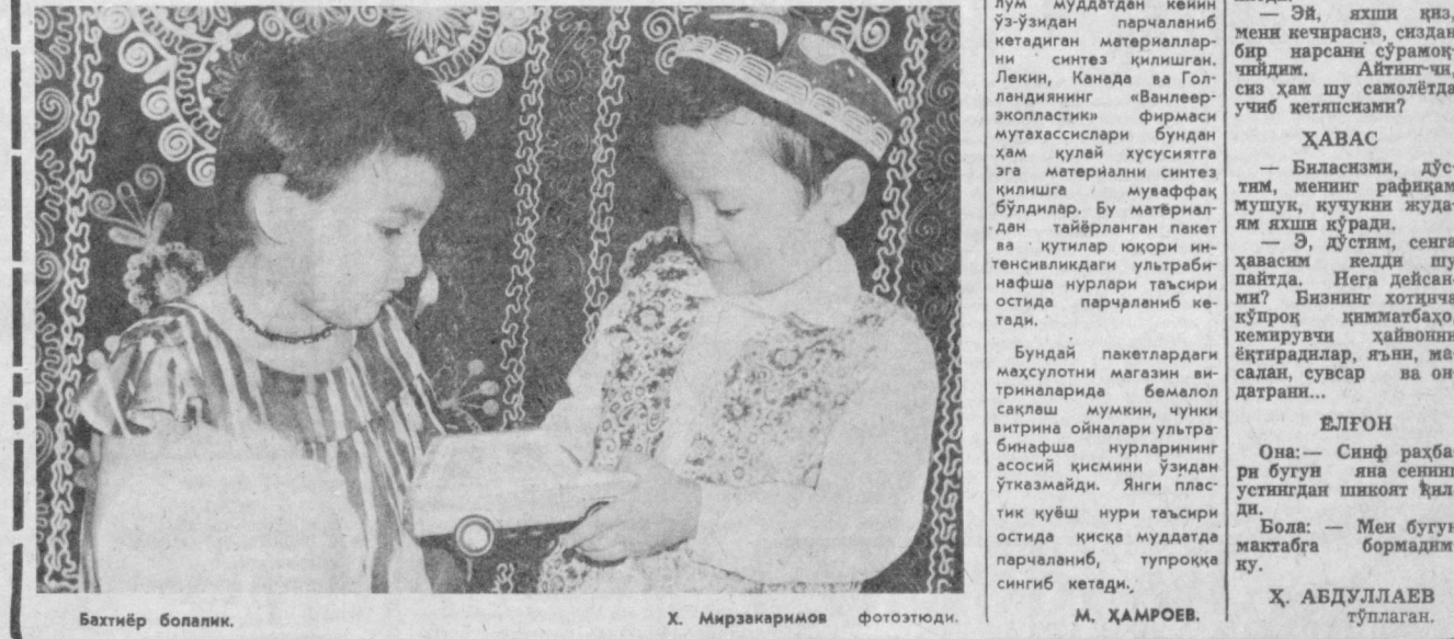
Бахтиёр боляки. Х. Мирзақаримов фототюди. М. ҲАМРОЕВ.

эса япон тадбиркорлиги ва тежакорлиги эди ҳолатда маҳаллий дарахтининг бир муноча ноёб навандан ишлаб чиқарилади. Бу маъна шундай қимматли анъана. Бирок, мамлакатда қаламча чўпларнинг талон-тарож бўлишига қарши кураш авж олиб бормоқда. Кўплаб японлар бундай ксрофгарчилик анъанасига қарши чиқмоқдалар.