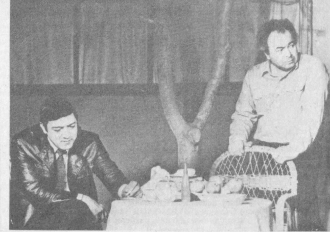
Ленин орденли Ҳамза номдаги Ўзбекистон Давлат академик театри кўлаб етук асарлар билан меҳнаткашларини баҳраманд қилиб келаяпти. Кейинги вақтда театрининг ижодий коллективини бир қатор янги саҳна асарларини томошбинларга тақдим этишди. Янгида санъаткорлар томонидан саҳналаштирилган таниқли ўзбек адаби Учкун Назаровнинг «Ойна» драматси...