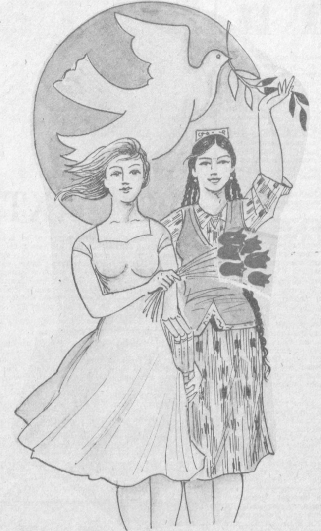
Рисом А. Холиқов.

Мен газеталарнинг аски саҳифаларини ва рақидий туриб, қуйида-ги қизиқ хабарни учра-тиб қолдим. «Правда Востока» газетасининг 1925 йил март сонид-а бундай деб ёзилган ояпа: «Тошкентда би-ринчи марта мактабга-ча ёшдаги тарбиячи ходимларнинг курси очилиб, унга 50 киши ўқишга келган». Ҳа, чиндан ҳам Совет ҳокимиятининг дастлабки йилларида ҳам болалар тарбияси-га алоҳида эътибор бе-рилган. Ушда даврда болалар богчалари ва унинг тарбиячилари етишмаслигига қара-масдан, кўпгина тад-бирлар амалга оши-рилган. Эндиликда, бутун-лай бошқа манзарани кўриш мумкин. Ҳозир, да шаҳримизнинг ҳар бир кварталда иккита-учтадан болалар бог-часи бор. Кунин-кеча Халқлар дўстлиги проспектида, ги ўрта мактабининг со-биқ биносиди яна бит-та болалар богчаси очилди. У 491-бахти-ерлар масканидир. Бу ерда меҳрибон тарбия-чилар ўғил ва қизлар-га парвона бўлишмоқ-да. Ҳозирги пайтда пой-тахтимизда 600 дан ор-тиқ болалар богчаси ишлаб турибди. Улар-да тарбияланаётган фарзандларнинг сон-и 100 мингдан ошди. Д. МАЖИДХЎЖАЕВА