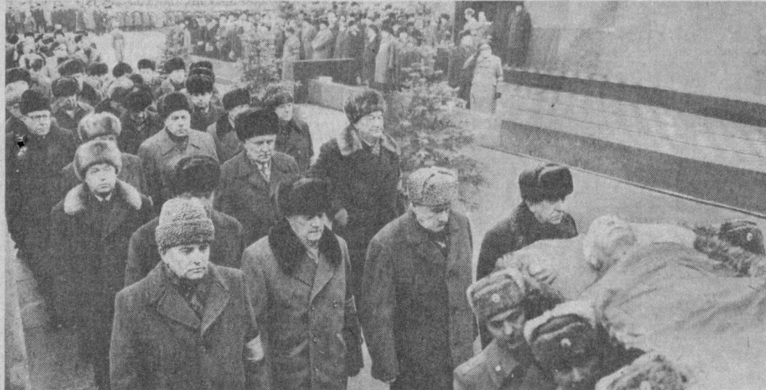
К. У. Черненко дафн этиш маросимида.

Алвидо, азизимиз Кон- стантин Устинович!