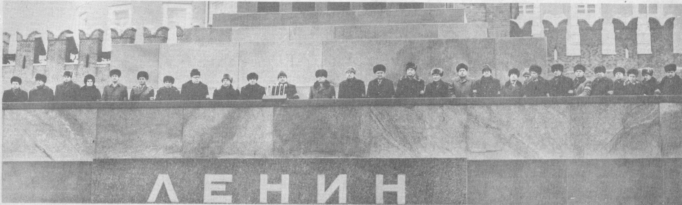
Москва, 1985 йил 13 март. В. И. Ленин Мавзолей минбарда.

Кеча совет халқи К. У. Черненко сўнги йўлга кузатиб қўйди. Советлар мамлакати меҳнаткашлари Коммунистик партия ишига садоқат би- лан хизмат қилиш, унинг кўрсатмалари- ни сабот билан амалга оширишга азма қарор қилганликларини изҳор этмоқдалар.