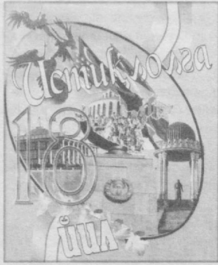
(Давоми. Бошланиш 1-бетда).

Касб-хунар коллежлари ва академик лицей битирувчиларига меҳнат қилиш фаолияти билан боғлиқ ҳуқуқ ва мажбуриятларини тушунтириш, мақбул келадиган ишларни тақлиф этиш мақсадида бандликка кўмаклашувчи марказлар билан ҳамкорликда меҳнат ярмаркалари ўтказиш орқали уларнинг бандлигини таъминлашга устувор вазифа сифатида қаралди.