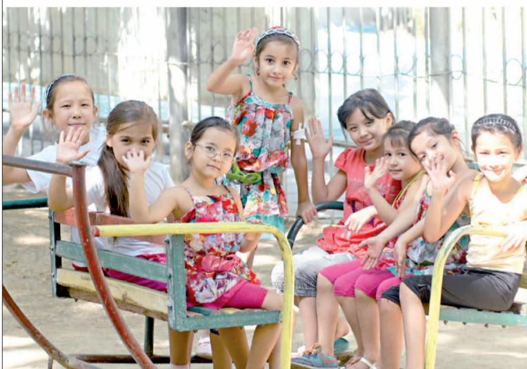
Суратларда: «Зилола» оромгоҳи дам олувчилари.

иштирок этиши кутилаётган бу жажжи санъат гуначалари мамлакатимиз мустақиллигининг 20 йиллигини муносиб нишонлашга ўз ҳиссаларини қўшиш ниятида.